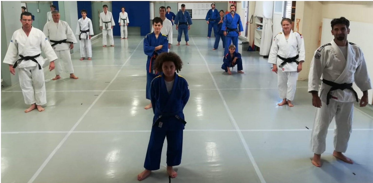
Il·lustració 4: Exemple de classe sense contacte

Aquest escenari ens permet poder mantenir un contacte visual i compartir un espai. Aquest escenari permet poder tenir contacte visual entre els nins, ja sigui amb grups grans (més de 10 alumnes) i estables (sense canvis entre grups), grups "bombolla" (grups de fins a 10 alumnes i estables).