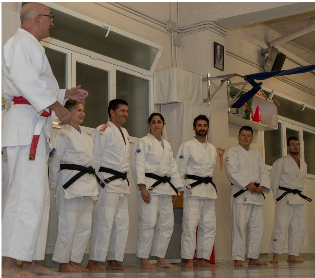
Il·lustració 1: Professors del judo del Club Dojo Muratore

Mestre Entrenador Nacional de Judo Mestre Entrenador Nacional de Defensa Personal 5è DAN de Judo 3r DAN de Defensa Personal