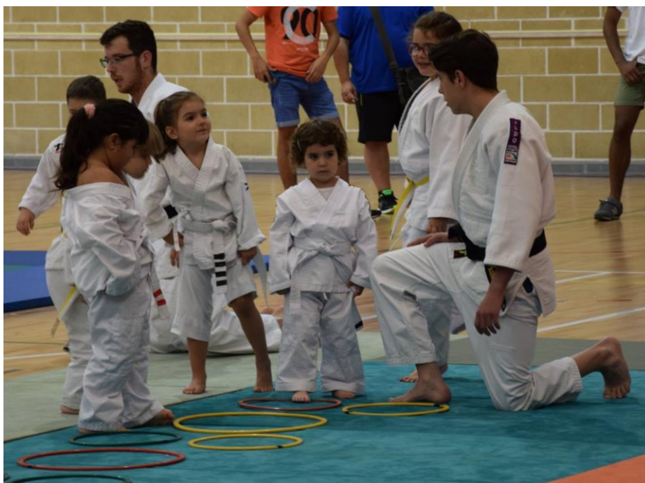
Il·lustració 3: jocs i treballs possibles a l'escenari A