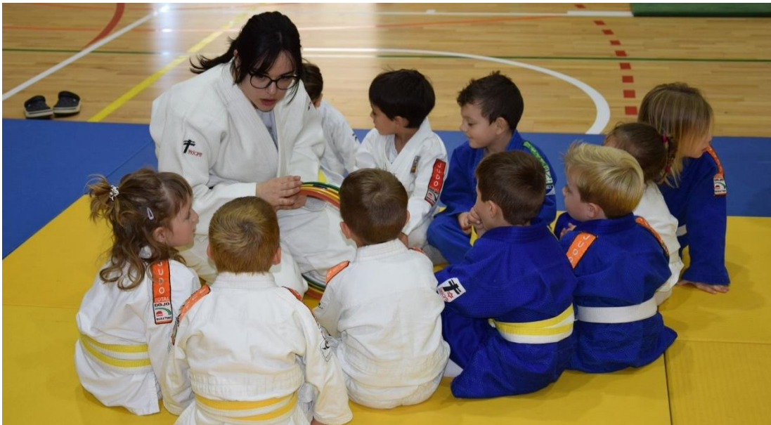
Il·lustració 2: Exemple de classe amb grup bombolla

Aquest escenari és el que s'assembla més a la realitat que hem viscut fins als darrers anys. Aquest escenari permet poder tenir contacte entre els nins, ja sigui amb grups grans (més de 10 alumnes) i estables (sense canvis entre grups), grups "bombolla" (grups de fins a 10 alumnes i estables) o contacte amb una sola persona (treballs amb una mateixa parella de forma estable).