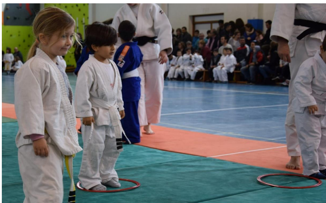
Il·lustració 5: jocs i treballs possibles a l'escenari B